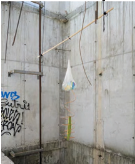
FIG. 4. Cristina Mejías. Lo lento es suave, lo suave es rápido, 2020. Dos estructura metálicas del esqueleto del edificio, cuerda elástica, vara de madera, malla de algodón, fragmentos de graffiti encontrados, hoja de pita falsa, cobre y hueco de ascensor. Medidas cambiantes. Imágen de @mismovisitante. 2020.