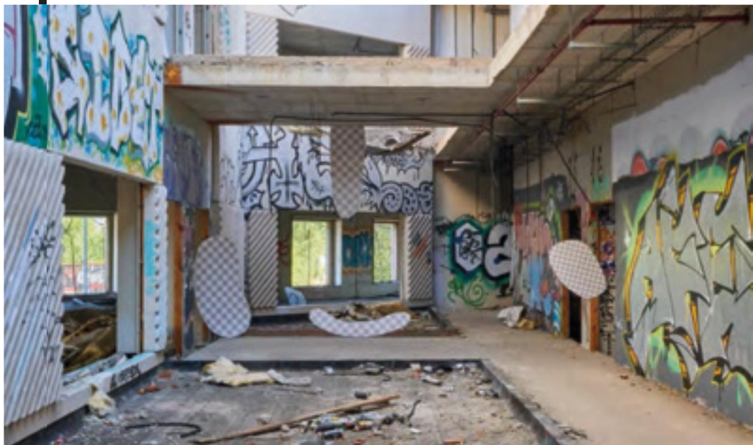
FIG. 3. Miguel Ángel Tornero. Nueva capa a partir de fondo, 2020 Intervención específica. Dimensiones variables. 2020.