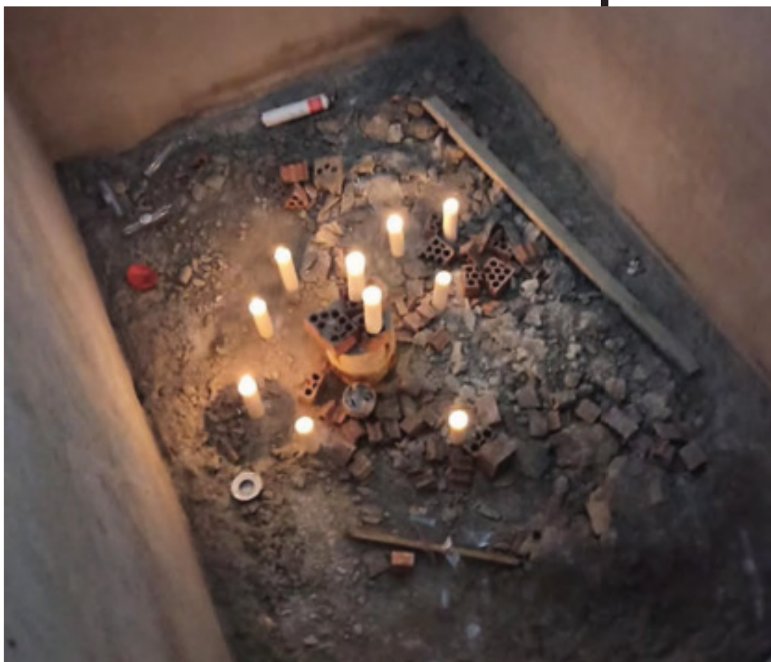
FIG. 2. Eloy Arribas. Planta -2 Sur Noroeste. Imágen de @mismovisitante. 2020.