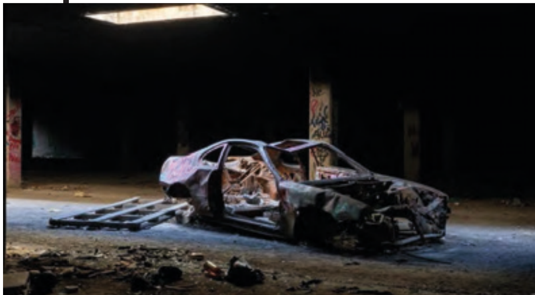
FIG. 5. ACCA (André Covas & Carmo Azeredo) Ozymandias, Aragón Park, 2020 Imágen de @mismovisitante. 2020.