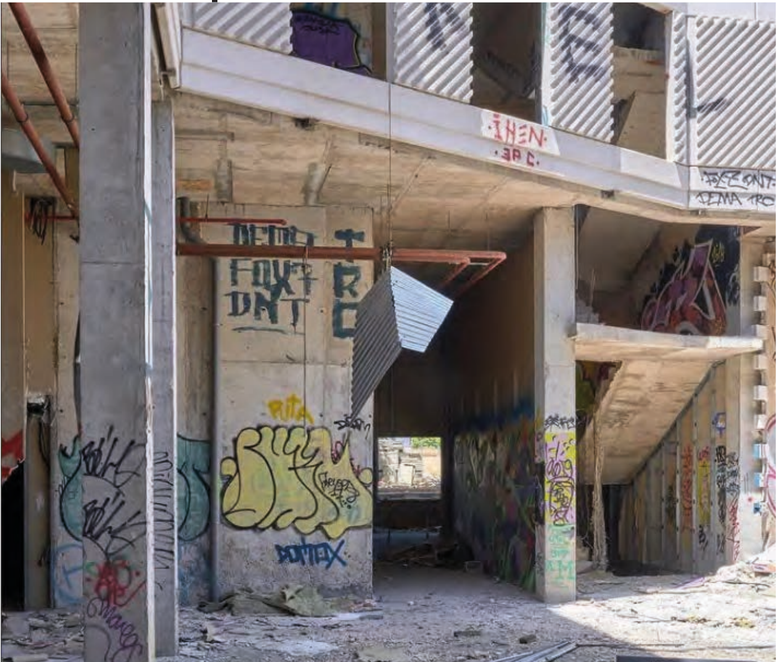
FIG. 1. Recorrido aerostático (prototipo 1), 2020 Estructura de chapa minionda 300 x 150 x 150 cm Imagen de @mismovisitante. 2020.